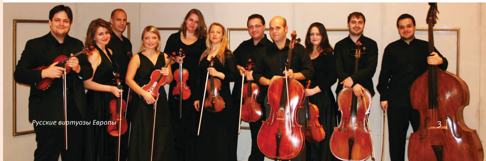
Русские виртуозы Европы